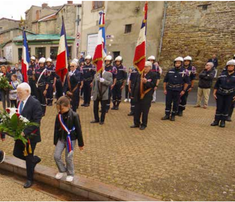
Cérémonie du 8 mai 2023

L'année 2024 s'inscrit dans la même dynamique. Elle sera l'année de l'étude de faisabilité d'un réseau chaleur sur notre commune (utilisant la chaleur résiduelle de l'usine Saipol), mais aussi celle du lancement du contrôle des installations d'assainissement non collectif par le SPANC (service public d'assainissement non collectif) de l'intercommunalité.