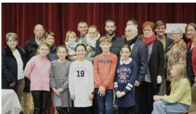
Vœux à la population, le conseil municipal entouré des nouveaux élus du conseil municipal des jeunes et des nouveaux habitants